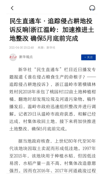
图：《民生直通车·追踪侵占耕地投诉反响》报道截图