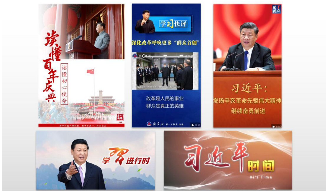
图：习近平总书记报道重点栏目

经济思想的生动实践”“习近平的小康故事”“新思想引领新征程”等主题报道浏览量创近年同类主题报道新高，充分展现了习近平总书记领航掌舵的核心作用和习近平新时代中国特色社会主义思想的真理力量。不断加强全媒传播，“第一观察”“第1视点”“学习进行时”“习近平时间”等重点栏目形成融媒体矩阵，推出《望北斗》《复兴·领航》等260余组浏览量过亿的现象级融媒体产品。大力推进对外宣传，《习近平带领百年大党奋进新征程》人物特稿被路透社等2000多家媒体转载，“习近平的故事”系列外宣微视频在海外社交媒体平台平均浏览量过千万，生动展现习近平总书记大党大国和世界级领袖的形象风范。