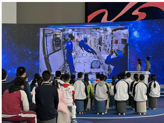
图：《太空课点燃科学梦》报道截图

围绕神舟十二号、神舟十三号发射返回等节点，播发《霜染东风，秋揽神舟》《月下棹神舟 星夜赴天河》等报道，普及航天科学知识，激发受众民族自豪感、自信心。播发融媒体现场新闻《太空课点燃科学梦》，呈现太空授课现场亮点，彰显载人航天跨越式发展和一代代孩子们心中的航天科学梦。