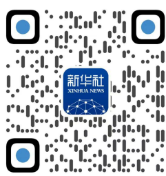
新华社客户端二维码