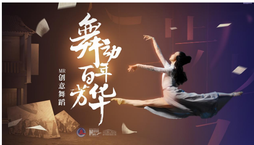
图：MR 创意舞蹈《舞动百年芳华》报道截图

坚持以内容创新为根本，推出《风雨百年味》《28岁的你》等系列重磅产品。深化“揭榜挂帅”机制，围绕春节、全国两会、五四青年节、东京奥运会、中秋国庆等重要节点策划推出《舞动百年芳华》等10余个优秀创意产品，系列产品全网总浏览量突破22亿。改造升级“国家相册”“声在中国”等精品栏目，推出《英雄时代》《国社MV：我飞向你，星辰大海》等一批精品报道。成功研发数字航天员、新华社数字记者“小诤”，在神舟十二号载人飞行任务实施期间推出并受到广泛关注。