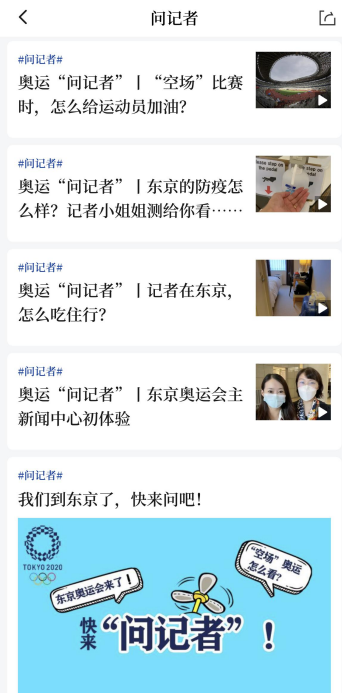
图：东京奥运会“问记者”系列互动报道截图

不断完善覆盖全球的新闻信息采集网络，形成了多语种、多媒体、多渠道、多层次、多功能的新闻发布体系，每天 24 小时不间断向国内外用户提供政治、经济、文化、社会等各个方面新闻信息产品。适应新闻社交化发展趋势，推出特色化对象化、沉浸式交互式新闻信息服务，办好新华社客户端“问记者”等平台，有效满足网民信息需求。