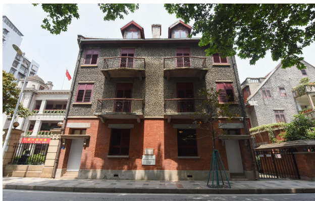
图：“听文物讲故事”专栏报道截图