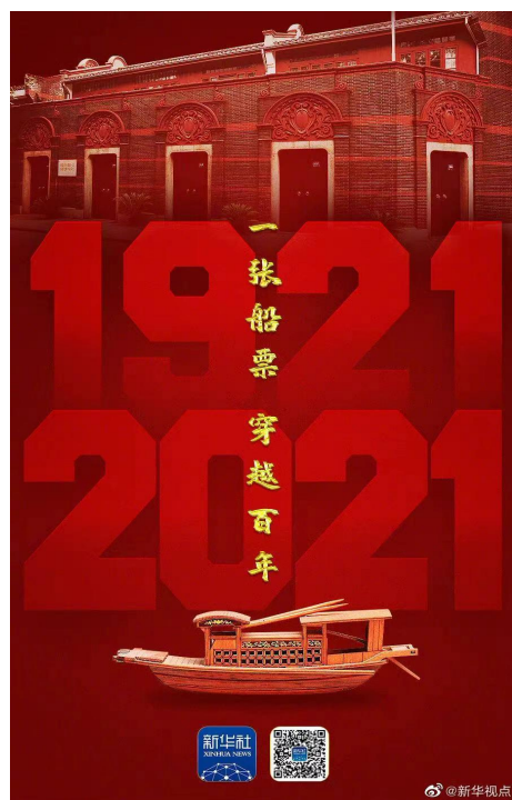
图：《2021，送你一张船票》报道海报

把庆祝建党百年作为全年报道主题主线，《钟华论|百年风华：读懂你的样子》《百年恰是风华正茂》《百国百党看百年大党》等重磅报道发挥“龙头”“压阵”作用，《2021，送你一张船票》《C位是怎样炼成的》等一大批爆款级融媒体产品产生广泛影响，“七一”庆祝大会报道全网传播量超过30亿，营造了同庆百年华诞、共铸历史伟业的浓厚氛围。精心组织党史学习教育宣传报道，《风雨苍黄百年路，高歌奋进新征程》等稿件被各大媒体广泛采用，为党史学习教育营造良好舆论氛围。圆满完成党的十九届六中全会和全国两会、西藏和平解放70周年、第四届中国国际进口博览会等重大战役性报道，推出《彪炳史册的伟大成就，坚如磐石的中流砥柱》等重点报道和H5《史上最难考卷，请你阅评》等融媒报道，形成正面舆论强势。