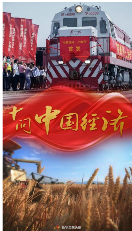
图：《十问中国经济》报道截图

做好经济形势舆论引导，推出《十问中国经济》等重点稿件，释放中国经济长期向好之势不可逆转、中华民族伟大复兴历史进程不可逆转的鲜明信号，有力提振信心、稳定预期。针对成都 49 中学生坠楼等重大舆情事件，及时播发权威稿件，客观还原事件原貌，起到一锤定音作用。精心组织“热点快追”“热点快评”等栏目，议题设置能力不断提升。把新媒体端作为舆论引导主平台，运用客户端、微博、微信、抖音等平台有效发声，基本实现热点话题全覆盖。