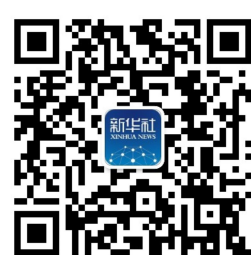
新华社微信公众号二维码