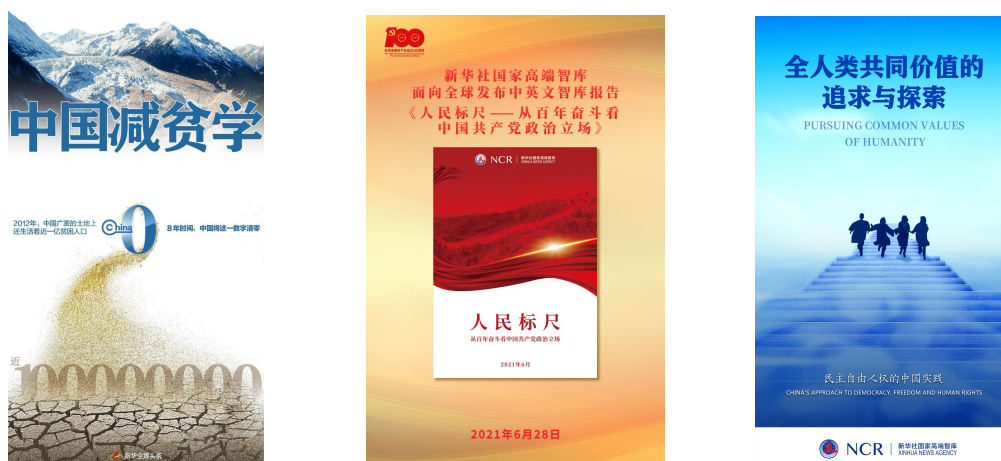
图：《中国减贫学》《人民标尺》《全人类共同价值的追求与探索》智库报告

参与搭建运行中国政府网、国务院电子政务一体化服务平台、中国文明网、中国一带一路网、中国雄安官网、中国应急信息网等重要政务网站，为社会和公众提供信息服务。在新华社客户端上线社会治理交互平台“全民拍”栏目，新华网上线“我为群众办实事”网络平台，成为推动解决百姓急难愁盼问题的重要渠道。国家高端智库建设取得一系列开创性成果，《中国减贫学》《人民标尺》《全人类共同价值的追求与探索》等多篇智库报告产生重大反响，对接社会机构和企业组织重点课题研究，为经济社会发展提供理论支持和智力服务。